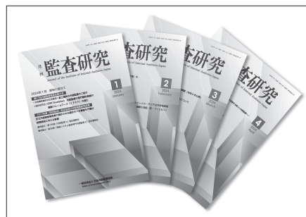
〈協会機関誌〉『月刊監査研究』（月1回発行）